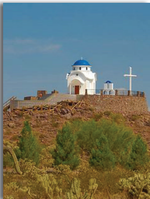
Монастырь основанный старцем в Америке

Плакать, как плакал апостол Пётр после отречения своего от Учителя[5].