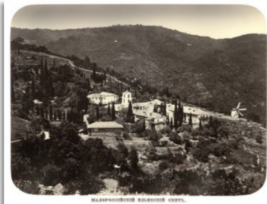
Маларосетский ефесский скит.